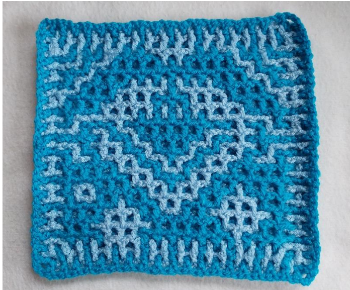
Het blok aan de achterkant met rand