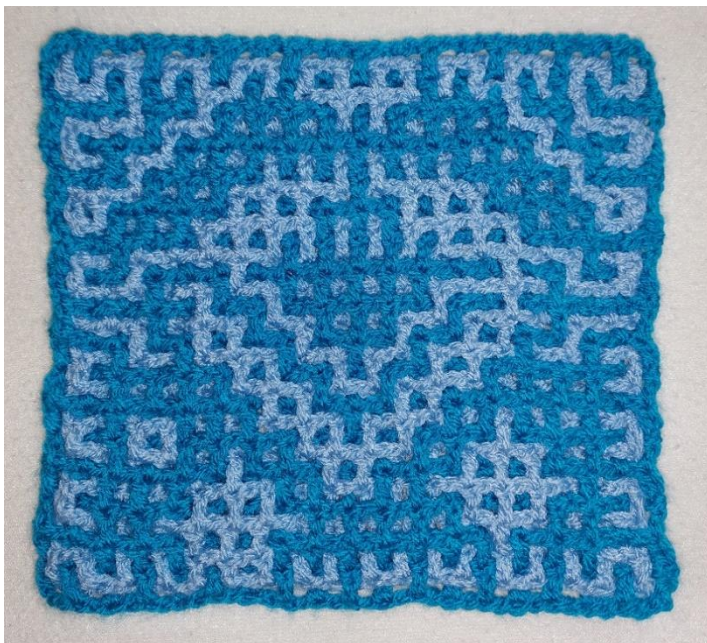
Het blok aan de achterkant zonder rand