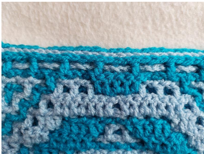
Detail van de rand aan de bovenkant