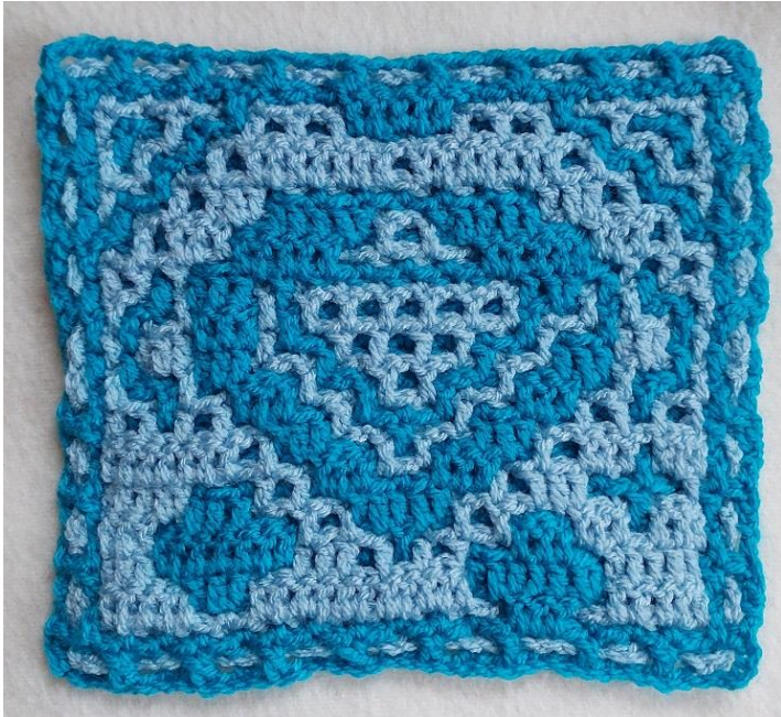
Het blok aan de voorkant zonder rand